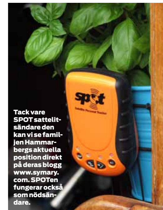
Tack vare SPOT satellitsändare den kan vi se familjen Hammarbergs aktuella position direkt på deras blogg www.symary.com . SPOTen fungerar också som nödsändare.