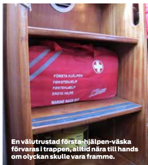
En välutrustad första-hjälpen-väska förvaras i trappen, alltid nära till hands om olyckan skulle vara framme.