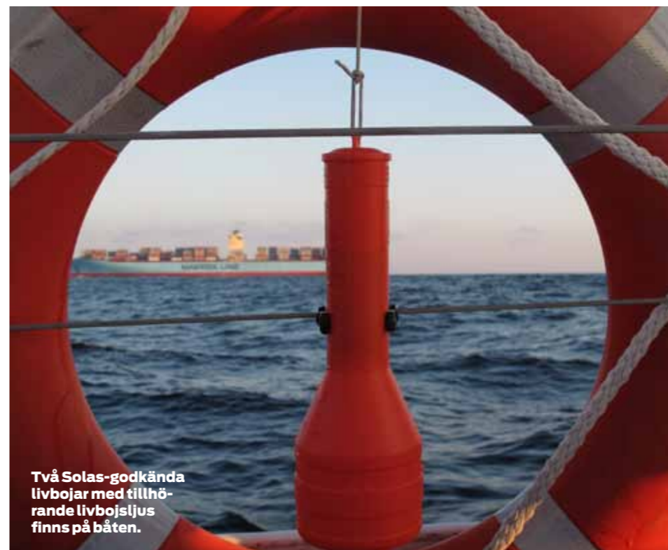
Två Solas-godkända livbojar med tillhörande livbojsljus finns på båten.