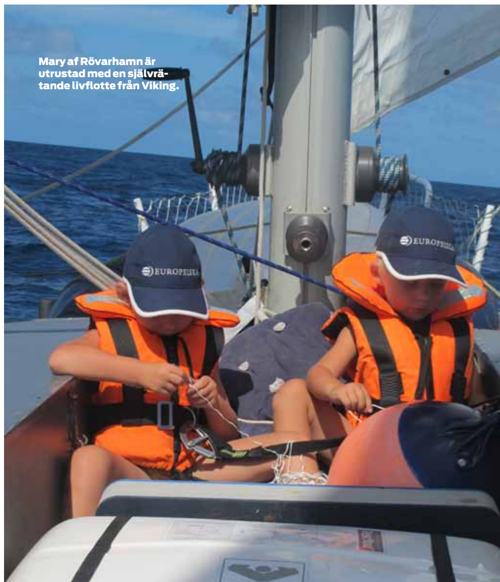
Mary af Rövarhamn är utrustad med en självvrätande livflotte från Viking.