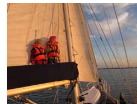
Lazy bags, en kombination av lazy jacks och bomkapell, har underlättat segelhanteringen på båten lika mycket som ett rullsegel.