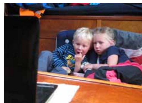
Film kan göra underverk när de vuxna behöver koncentrera sig på annat. Men det gäller att hålla på trumfkortet tills det verkligen behövs.